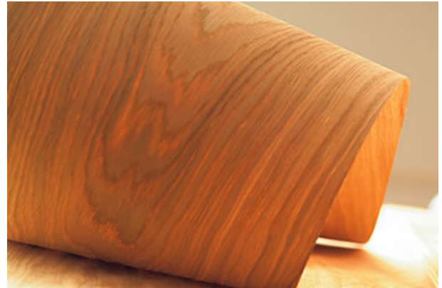
Miracol 6260 für anspruchsvolle Furnierarbeiten – kurze Presszeiten – praktisch durchschlagsicher – hervorragende Klebresultate.

Bitte die Verarbeitungshinweise auf dem technischen Merkblatt beachten. Dieses ist jederzeit auf unserer Webseite geistlich.ch (Bereich Adhesives) abrufbar.