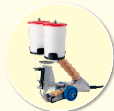
Handstitcher Handgerät zum manuellen Ausbessern und Abkleben von Furnierblättern